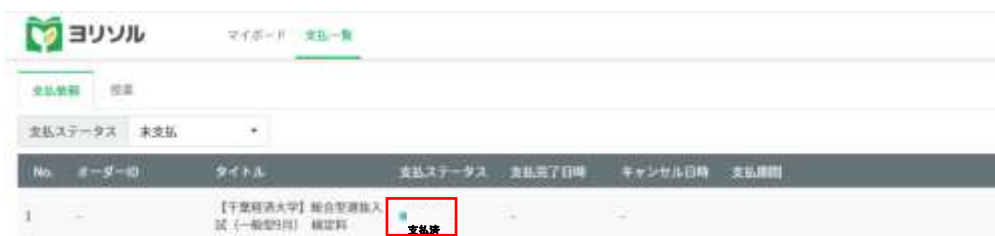
画像⑤ 支払一覧表示画面

一度納入された入学検定料の返還は認められません。ただし、二重納入をされた場合、お申し出ください。