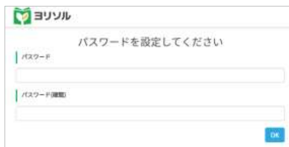
画像③ パスワード設定画面

その後、ご希望のパスワードを指定して登録してください(画像③)。「パスワードが設定されました」と表示されたら登録完了となります。(画像④)