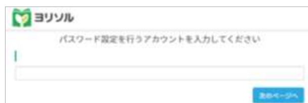
画像② アカウント(メールアドレス)入力画面

最初に「パスワード設定を行うアカウントを入力してください」という表示(画像②)が出ますので、登録したメールアドレスを入力し、「次のページへ」をクリックしてください。