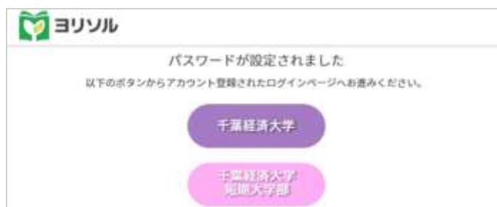
画像④ 登録完了後画面