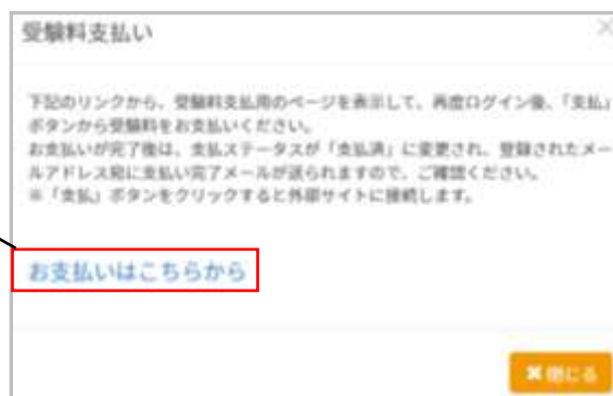
画像① 支払用ページへのリンク画面