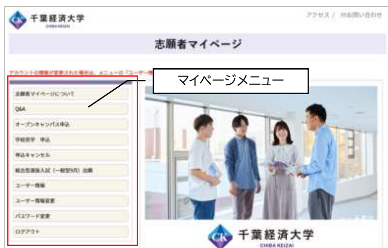
志願者マイページ