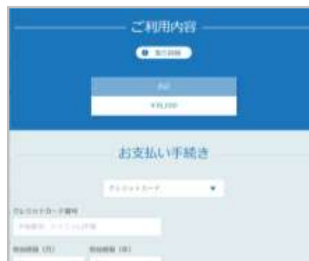
画像④ 支払手続き画面