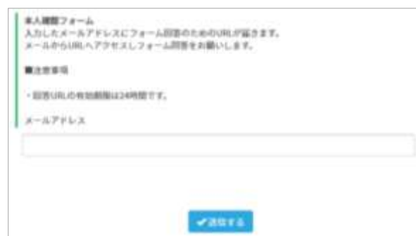
画像① 本人確認フォーム

ここでご登録いただいたメールアドレスは、マイページログインの際のアカウントとしても使用します。