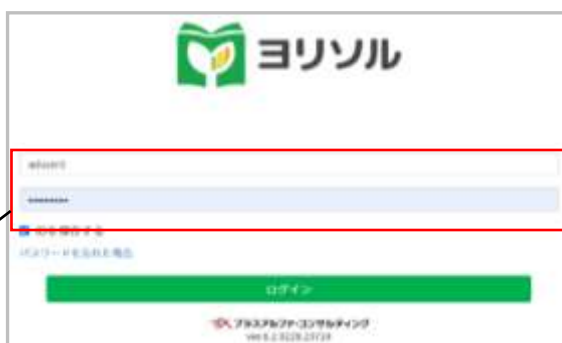
画像② 支払用ページ ログイン画面