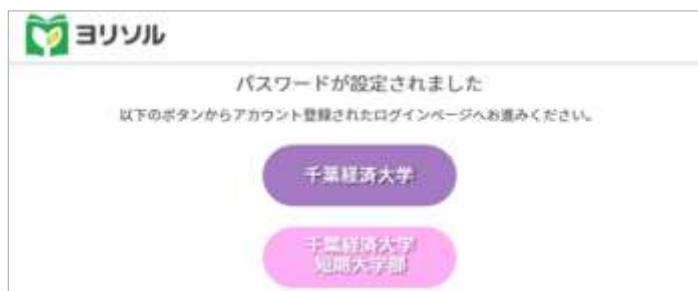
画像④ 登録完了後画面