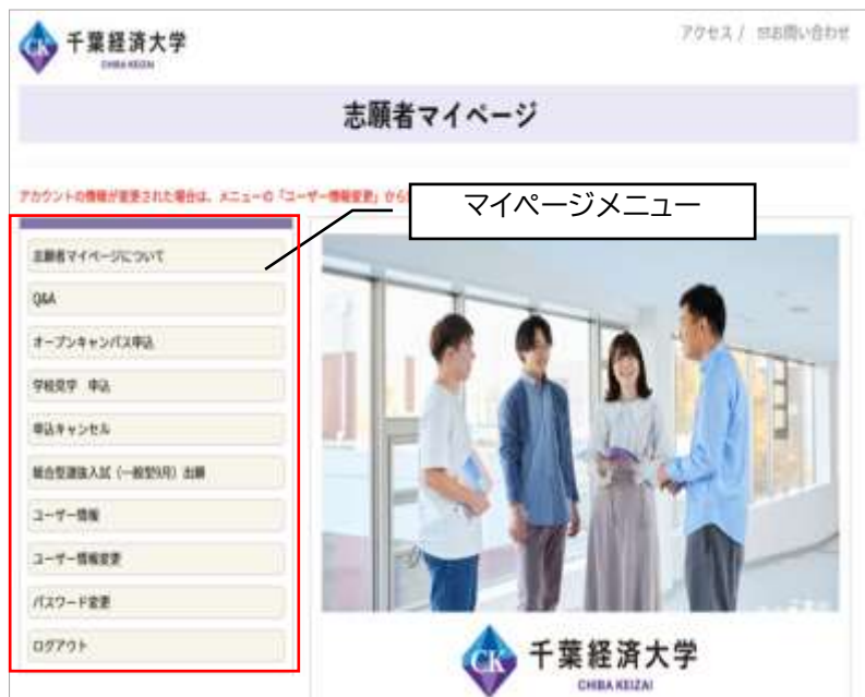
志願者マイページ