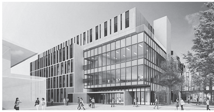
掲載CGは計画段階のものであり、施工上等の理由により変更となる場合があります。

創立七十周年に際しては、新校舎を建築しましたが、このたびは短期大学のキャンパスを大学と一体化して建築し、学園総体としての学習環境の充実に努めてまいりました。 この大業によって、本学園は千葉県として二十一世紀の日本に大いなる社会貢献を果たし、有為な人材を輩出する総合学園として飛躍することになります。 教育とは、学生・生徒一人ひとりの秘める豊かな可能性を限りなく引き出すことです。学園は建学の精神として「片手に論語 片手に算盤」を、大学・短期大学部は校是として「良識と創意」を、高校は校風として「明朗・真摯・友愛」を掲げています。 これらの教育理念・教育指針のもとで、人としての品位・品性と社会を支え動かす専門性を培い、卒業生にとっての「心のふるさと」、地域社会の方々には信頼される学園となつて教育の光明を灯しつづけてまいります。