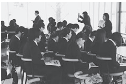
学生は昨年十二月に実施した就職ガイダンスでの告知効果もあり、前年度を大きく上回る二百六十八人が参加し大盛況でした。各ブースでは、ご担当者様から経営理念、事業内容および採用に関する情報に至るまで丁寧にご説明いただきました。学生たちは、将来のキャリアビジョンを描き、その実現に向け、事前選定した企業を最大で八社訪問することで、志望する業界はもろろんのごとく、様々な業界に触れることができ、新たな発見や新しい企業との出会いにつながる貴重な機会を得ました。皆が説明に真剣な表情で聞き入り、熱心にメモを取る姿も多く見られ、質疑応答が盛んに行われるなど、内容の濃い説明会を開催することができました。

三年生の皆さんには、これからの就職活動を通じて多くの人と出会い、様々な企業を見ることで知見を深めるとともに、世界を広げてもらいたいと思います。そして、前向きな姿勢と笑顔で就職活動に邁進してください。その行動力が将来の仕事においても大きく役立ちます。