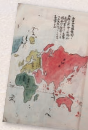
▲「異国図案」 (一宮町教育委員会蔵)