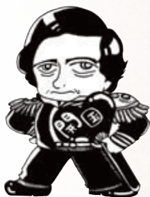
マスコットキャラクター ペリーくん

休館日／日曜日・月曜日・祝日・年末年始 ※11月25日(土)休館 開館時間／午前9時～午後4時