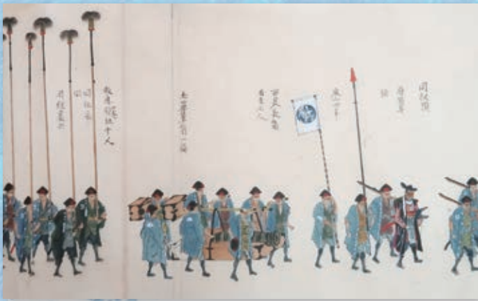
▲「大多喜藩陣列図(複製)」(千葉県立中央博物館大多喜城分館蔵)

一八世紀末、欧米列強が日本に迫ってきた。この対外的危機に対応するため「海防」が幕府の課題として浮上した。特に「江戸湾」(現在の東京湾)の防備が重視され、江戸湾の一角を形成する房総半島は海防政策の重要な地となった。房総の各地では諸藩をはじめ村役人や地引網の網元など、さまざまな主体が海防の担い手となった。本展示では、幕府や藩、そして地域の人びとが、幕末の房総半島に迫り来る対外的危機に対応したのか、地域に残された資料を中心に紹介する。