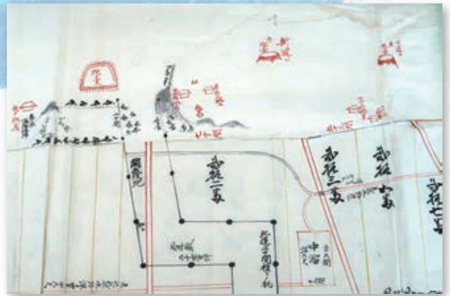
▲「芝地鹿絵図」(一宮町教育委員会)より一宮藩の台場