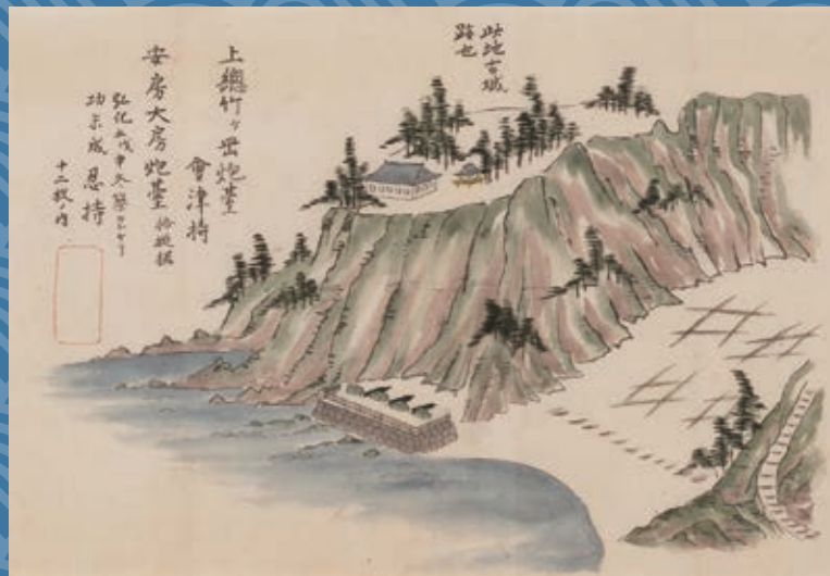
▲「江戸防備諸砲台之図」(船橋市西図書館蔵)より 「上総竹ヶ丘砲台」の図