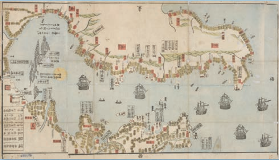
▲「海岸守備図」

一八世紀末、欧米列強が日本に迫ってきた。この対外的危機に対応するため「海防」が幕府の課題として浮上した。特に「江戸湾」(現在の東京湾)の防備が重視され、江戸湾の一角を形成する房総半島は海防政策の重要な地となった。房総の各地では諸藩をはじめ村役人や地引網の網元など、さまざまな主体が海防の担い手となった。本展示では、幕府や藩、そして地域の人びとが、幕末の房総半島に迫り来る対外的危機に対応したのか、地域に残された資料を中心に紹介する。