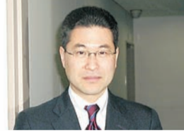
やまうら ひろゆき 山浦 裕幸 教授