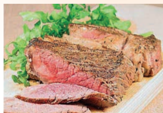
4月は ロースト ビーフ定食

時期は未定ですが、開催は同窓会HPでもお知らせいたしますので、同窓生の方もぜひこの機会にご来校いただき、ご試食(有料)ください。お楽しみに!!!