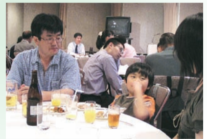
平成18年7月29日(土) 夕刻を予定。 同窓生同士、お誘い合わせのうえご来場下さい!

毎年恒例の同窓会総会・懇親パーティーのお知らせです。今年も県内ホテルにて開催予定です。開催の時期が近づきましたら郵送にて詳しい日時等をお知らせいたします。入場無料! 予定を空けてお待ち下さい。